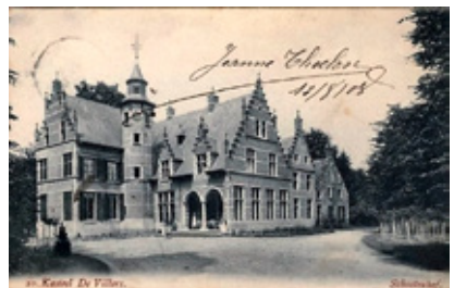
> Nieuw en oud