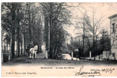
> Nieuw en oud