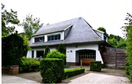
De Groene Oase