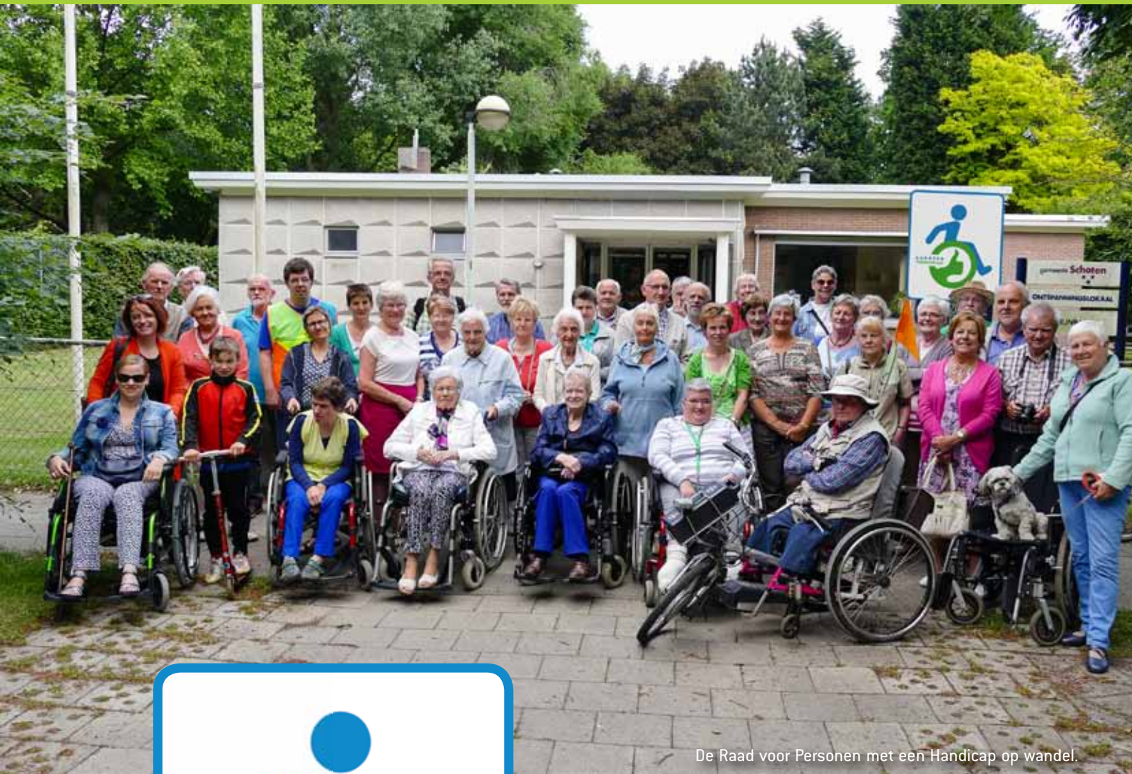
De Raad voor Personen met een Handicap op wandel.